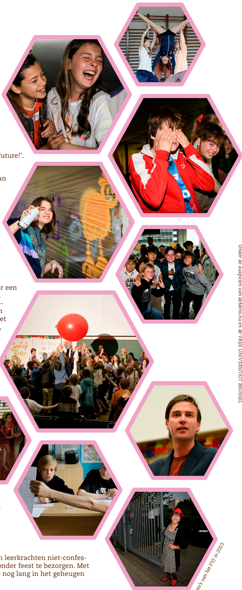
Onder de auspiciën van deMens nu en de VRIJE UNIVERSITEIT BRUSSEL

Het comité Feest Vrijzinnige Jeugd Gent, het Vrijzinnig Centrum Geuzenhuis, HuisvandeMens Gent, sympathisanten en leerkrachten niet-confessionele zedenleer werken samen om alle kinderen een bijzonder feest te bezorgen. Met interessante workshops en een spetterende voorstelling die nog lang in het geheugen mag blijven. Veel dank aan alle medewerkers!